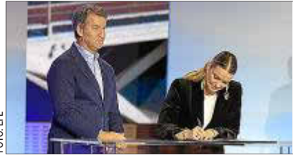
Prohens firma ante Feijóo, ayer.

► Negocia con empresas y sindicatos para alargar la actividad turística • Página 10