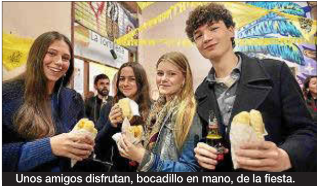
Unos amigos disfrutan, bocadillo en mano, de la fiesta.