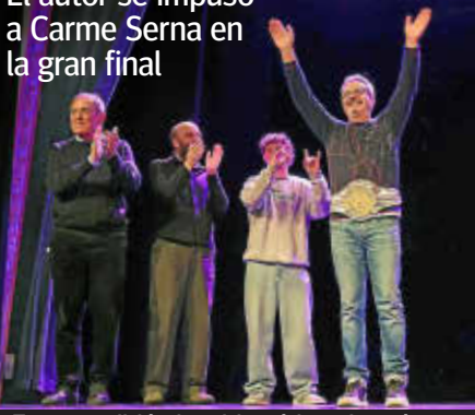
Ferrer recibió el emblemático cinturón.

El autor se impuso a Carme Serna en la gran final