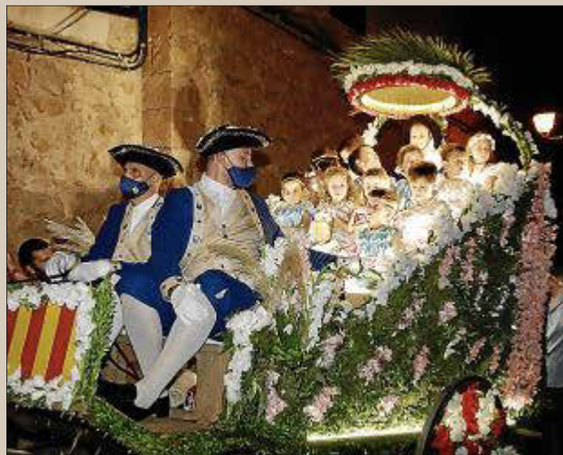
El Carro de la Beata, anoche, en las calles de Valldemossa.