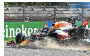
Los coches de Verstappen y Hamilton tras el accidente.