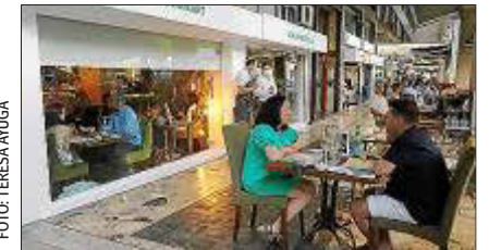
Terrazas llenas en el Passeig Mallorca.

La restauración estrena el primer fin de semana de casi normalidad