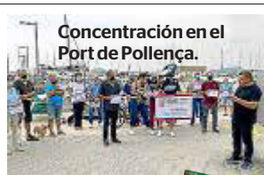
Concentración en el Port de Pollença.

Con esta edición, especial de 28 páginas por el Día Mundial del Medio Ambiente