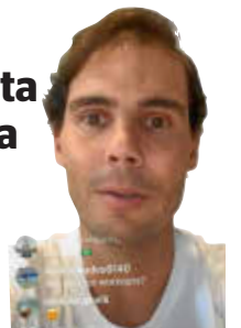
Nadal habló ayer vía redes sociales.