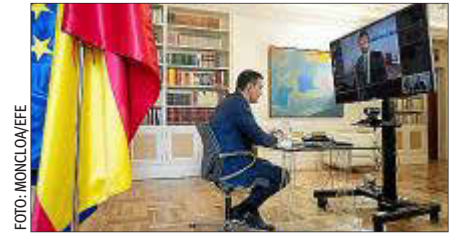
Pedro Sánchez y Pablo Casado conversaron durante más de una hora.