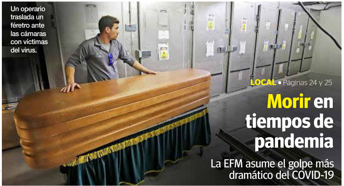
Un operario traslada un féretro ante las cámaras con víctimas del virus.