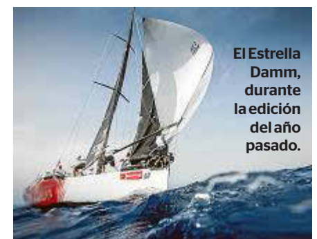
El Estrella Damm, durante la edición del año pasado.