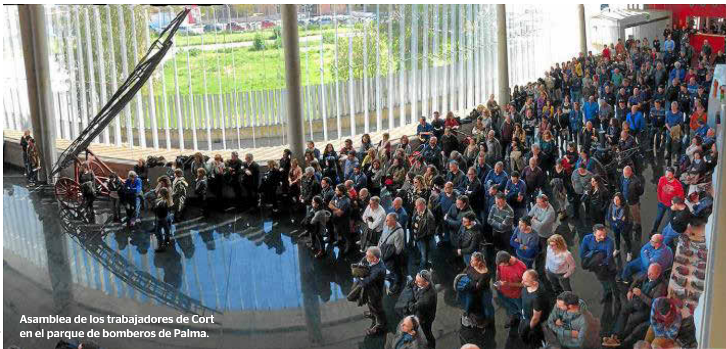
Asamblea de los trabajadores de Cort en el parque de bomberos de Palma.