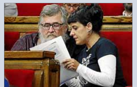
Dos jóvenes, al término del pleno de ayer.

La falta de una declaración de independencia decepcionó ayer a miles de personas