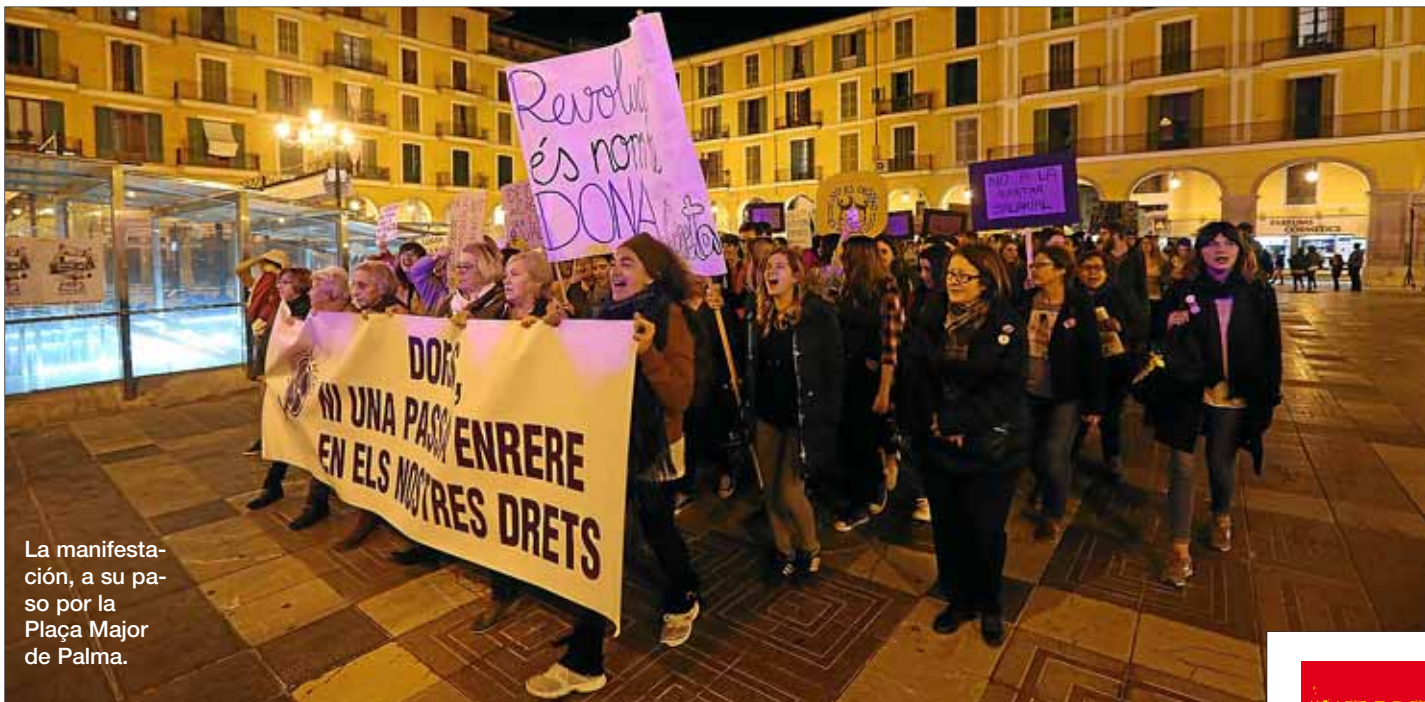
La manifestación, a su paso por la Plaça Major de Palma.