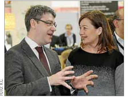
La presidenta Armengol coincidió con el ministro Nadal en la feria de Berlín.