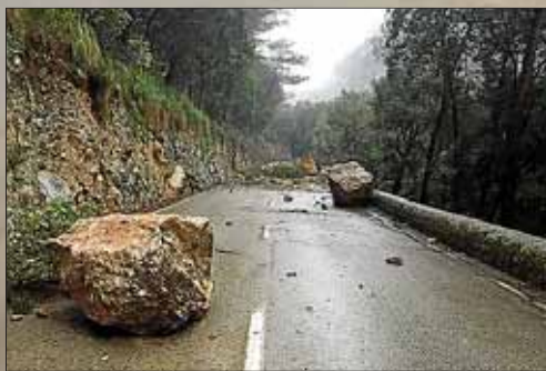
Las rocas caídas en el Coll de Sóller.

► La Aemet anuncia para hoy un recrudecimiento del temporal de lluvia y viento en toda la Isla