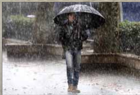
Un transeúnte pasea por es Born, bajo la lluvia.

► Suspendido el Correfoc, previsto para esta noche, y el Sant Sebastià Petit de mañana domingo