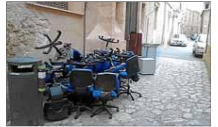
Imagen de decenas de sillas abandonadas en la calle de forma ilegal.

► López Negrete niega tener cuentas en Panamá • Páginas 20 y 21