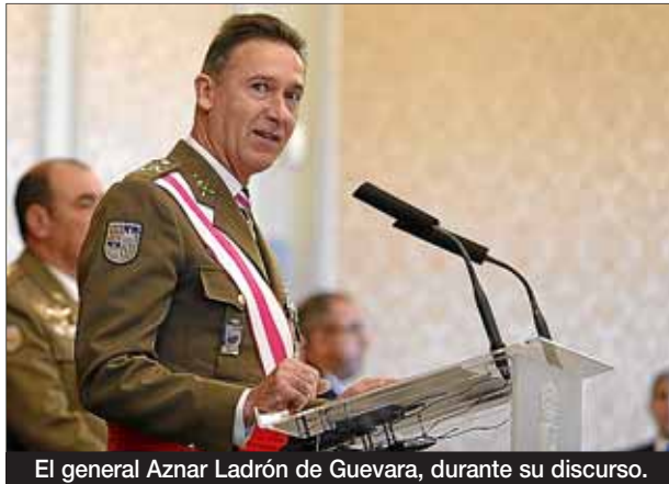
El general Aznar Ladrón de Guevara, durante su discurso.