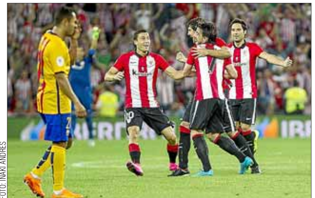
Los jugadores del Athletic celebran el primer gol.

DEPORTES • Página 42 El Athletic Club arrolla (4-0) al Barça y ya acaricia la Supercopa