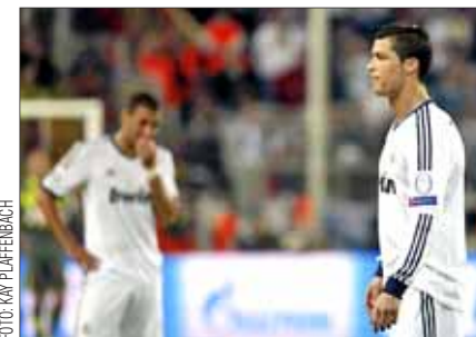
Ronaldo, en primer plano, anotó el gol del Madrid, pero no evitó la goleada.