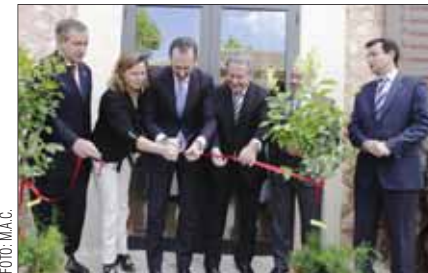
Las autoridades cortando la cinta inaugural antes de iniciarse la visita.