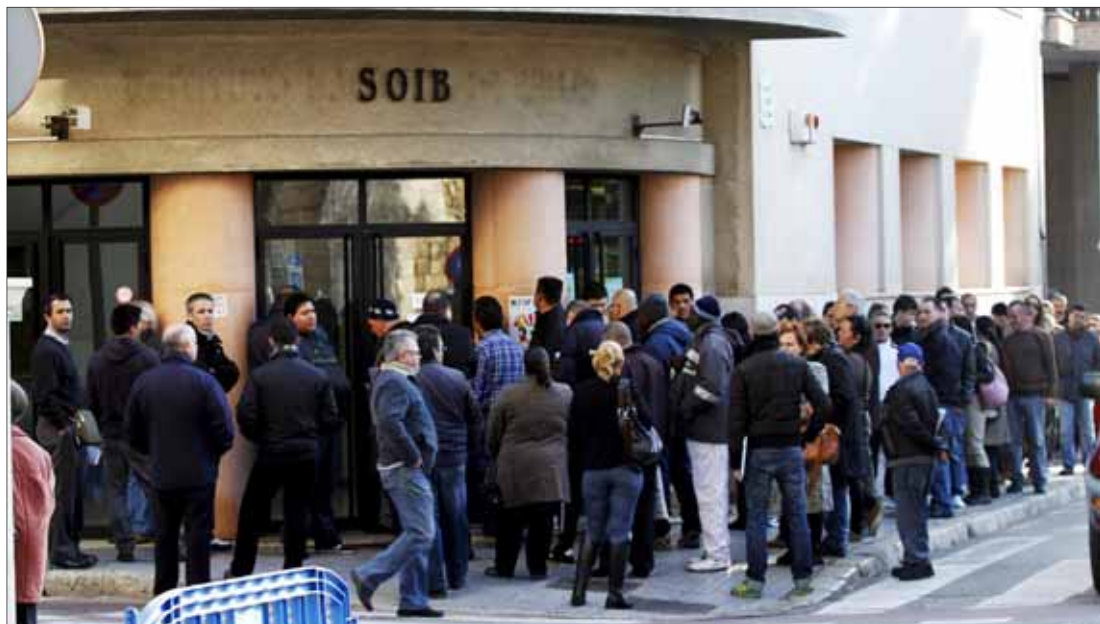
Parados haciendo cola, ayer, en una oficina del SOIB en Palma.