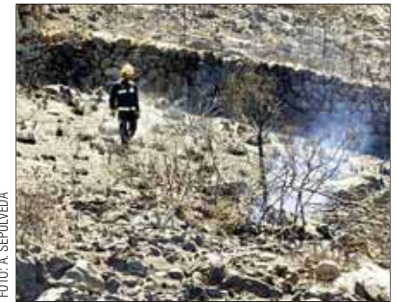
Un bombero en el área devastada por el fuego en Cales de Mallorca.