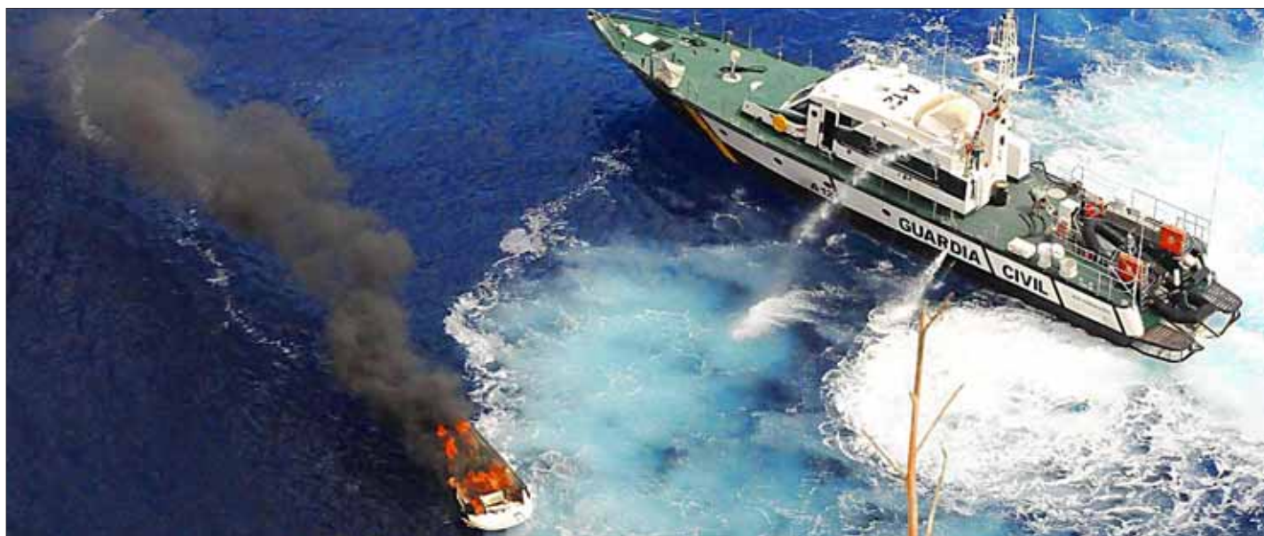
La embarcación se hundió tras el voraz incendio que la devastó por completo.