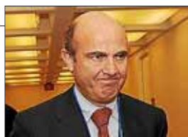
Luis de Guindos.