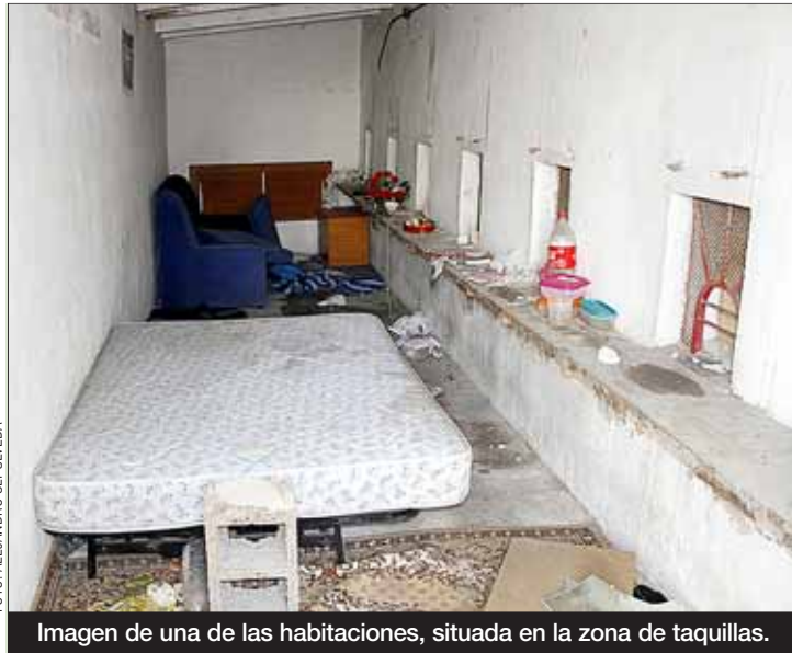
Imagen de una de las habitaciones, situada en la zona de taquillas.