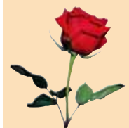
Las 'paradetes' de Sant Jordi en Palma fueron muy visitadas durante toda la exitosa jornada literaria.