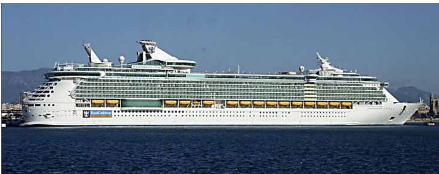
Impresionante imagen de un coloso de los mares con más de 300 metros de eslora en la bahía de Palma.