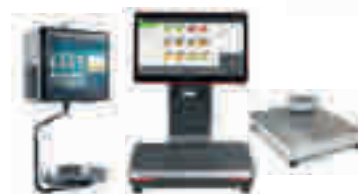
Balanzas y Básculas