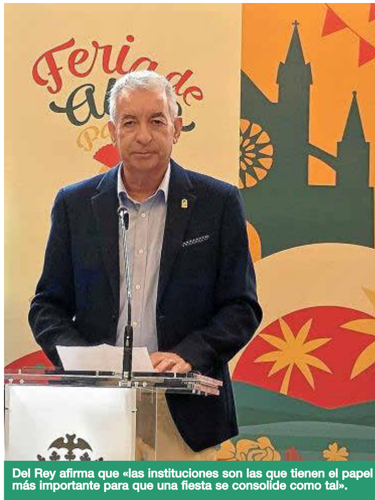
Del Rey afirma que «las instituciones son las que tienen el papel más importante para que una fiesta se consolide como tal».

—Más allá de la fiesta, hay mucha historia detrás. ¿Qué papel ha