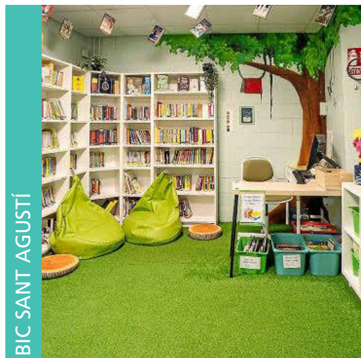
BIC SANT AGUSTÍ

El centro también defiende que la crianza implica a toda la comunidad educativa, por lo que concede gran importancia a la participación de las familias mediante jornadas y talleres, como la semana STEAM. En ese vínculo entre casa y escuela, el tutor desempeña