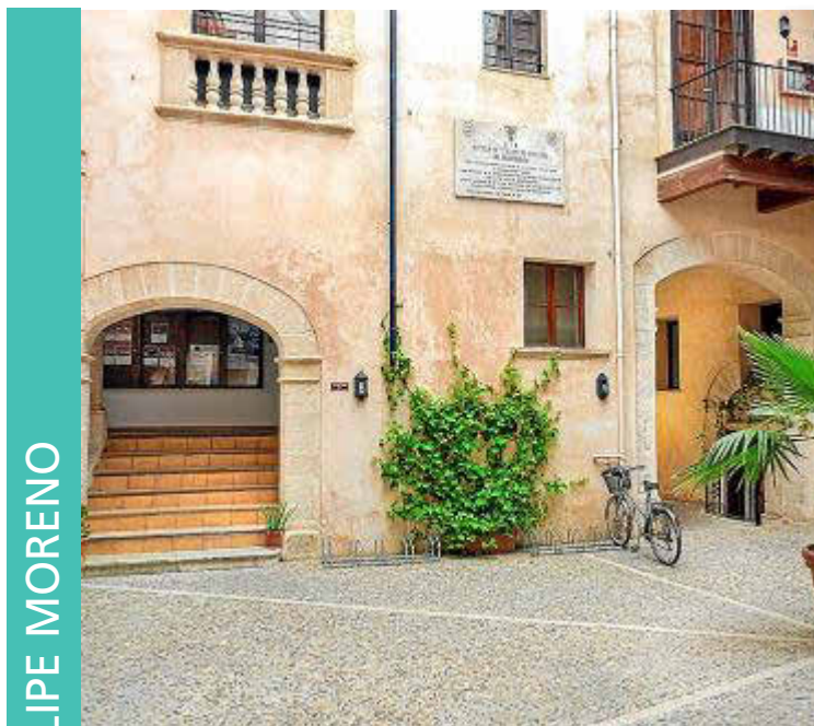
CENTRO UNIVERSITARIO FELIPE MORENO

En Turismo y Empresas Turísticas, el enfoque incorpora ámbitos como Business Intelligence, sostenibilidad, nuevas tecnologías y diseño de experiencias, reforzando una visión mucho más actual del sector. El Grado en Comunicación Estratégica, Protocolo y Organización de Eventos incorpora la mención en Influencers, Marca y Reputación, plenamente