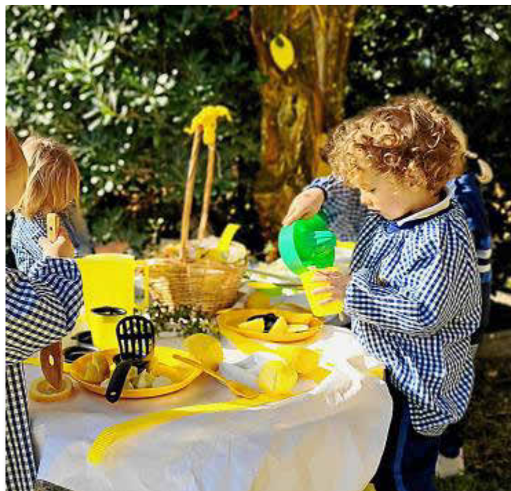
La Escoleta San Cayetano enmarca su labor educativa en el acompañamiento desde el cariño y el respeto.