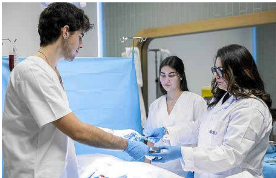
Todas las titulaciones se han diseñado con una orientación práctica desde el inicio de la formación.

El Centro Universitario Beato Luis Belda iniciará su actividad con grados en Medicina, Enfermería, Fisioterapia y Psicología