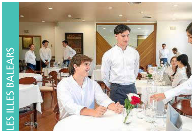
ESCOLA D'HOTELERIA DE LES ILLES BALEARS

Universitario en Dirección Hotelera, cuyo objetivo es el de proporcionar a los alumnos y alumnas los conocimientos y las habilidades necesarias para la dirección de empresas hoteleras y de restauración con prácticas externas en entornos nacionales e internacionales y con un alto nivel de formación en lengua inglesa y alemana. Esta formación se complementa con cursos más breves como son los certificados de profesionalidad dirigidos a personas desocupadas que realizamos de la mano del SOIB, y cursos de formación continua y a la carta para que empresas y profesionales puedan cubrir necesidades formativas más específicas.