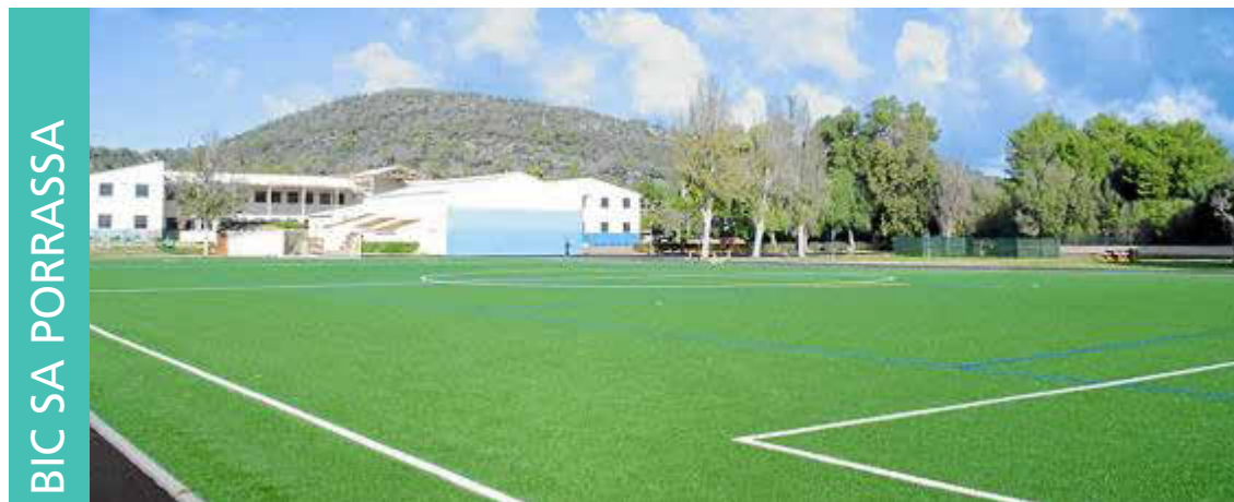
BIC SA PORRASSA

BIC Sa Porrassa cuenta con un equipo de profesionales volcados en el desarrollo de sus alumnos como apoyo y guía para ellos, además de inculcarles valores como la superación