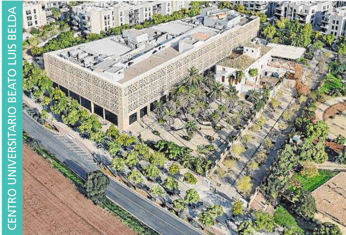
CENTRO UNIVERSITARIO BEATO LUIS BELDA

El campus se ubicará en el edificio del antiguo Riskal, cuya adecuación se ha planificado a partir de criterios de sostenibilidad y reutilización de una infraestructura existente, integrándola en el entorno urbano de