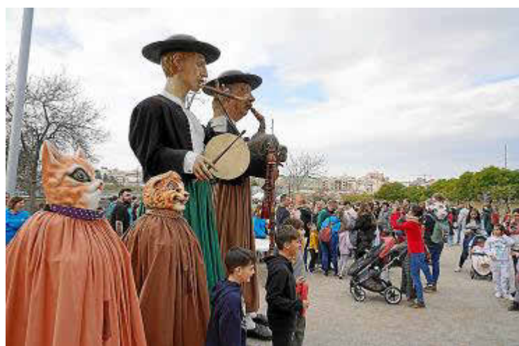
El encuentro de Gegants recorrerá Plaça de Cort, Carrer de Colom, Plaça Major, Plaça de Sant Miquel y Plaça de la Porta Pintada.

Encuentro de Bandas, a las 18 horas del sábado 24, en el Conservatori Superior de Música de les Illes Balears