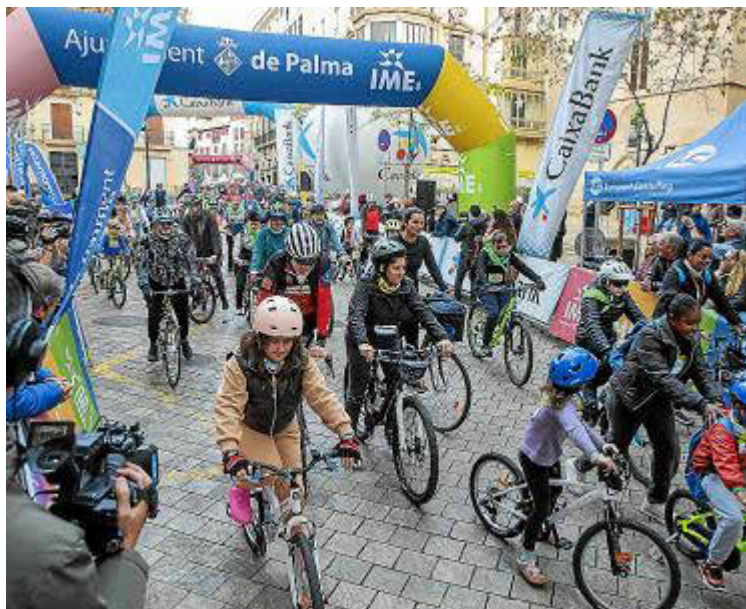
La Diada Ciclista y los Premis Ciutat de Palma serán el centro de miradas el próximo 20 de enero, día de Sant Sebastià.