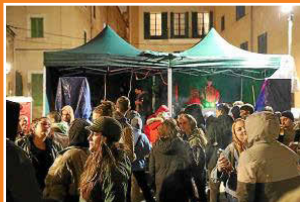
A partir de las 18 horas, un total de 41 músicos y DJ locales actuarán en seis plazas de los barrios de Canamunt y sa Calatrava.

trónica underground con actuaciones de Reya b2b Rastafairy, Deos, Squeezzo, Panda Creature, BoB y VSC, en el mismo horario vespertino y nocturno. La Plaça de Sant Jeroni acogerá artistas urbanos emergentes como la cantautora