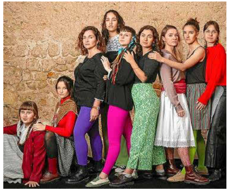
En la Plaça Major actuará el grupo Pitxorines. Por su parte, la popular banda Guaraná estará en Joan Carles I.

En esta ubicación se podrá disfrutar esta tarde de los conciertos en directo a cargo de Gintonic Band, La Canción del Verano y Madison. El planteamiento de los 'tardeos' refuerza el ambiente festivo en