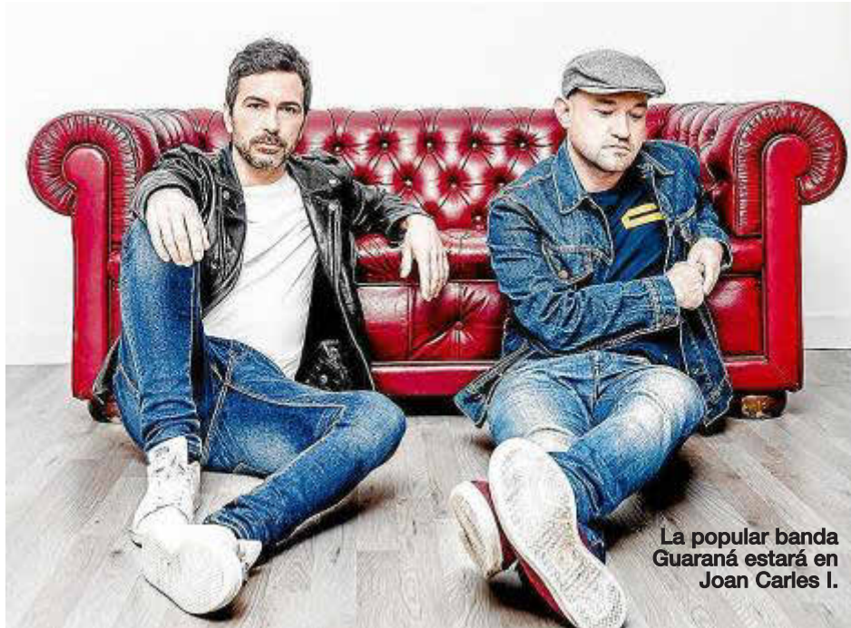
La popular banda Guaraná estará en Joan Carles I.

Palma se convierte en epicentro del talento con jornadas dedicadas a la electrónica y los sonidos urbanos. Bandas como Guaraná o Buhos lideran las propuestas del lunes, víspera del patrón de Ciutat