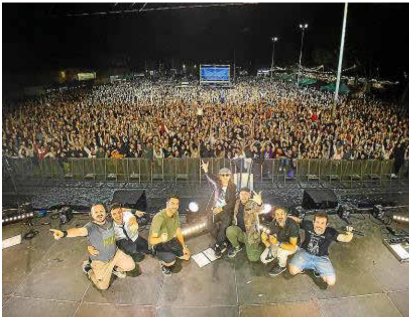
La banda catalana Buhos actuará en la Revetla de Sant Sebastià de este año en la Plaça Joan Carles I.