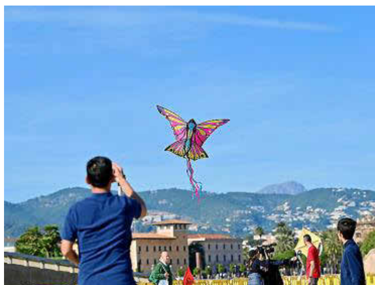
Un precioso taller de cometas y su puesta en vuelo es una de las actividades previstas para el domingo. La demostración de esgrima histórica (izquierda) será el 22 de enero.