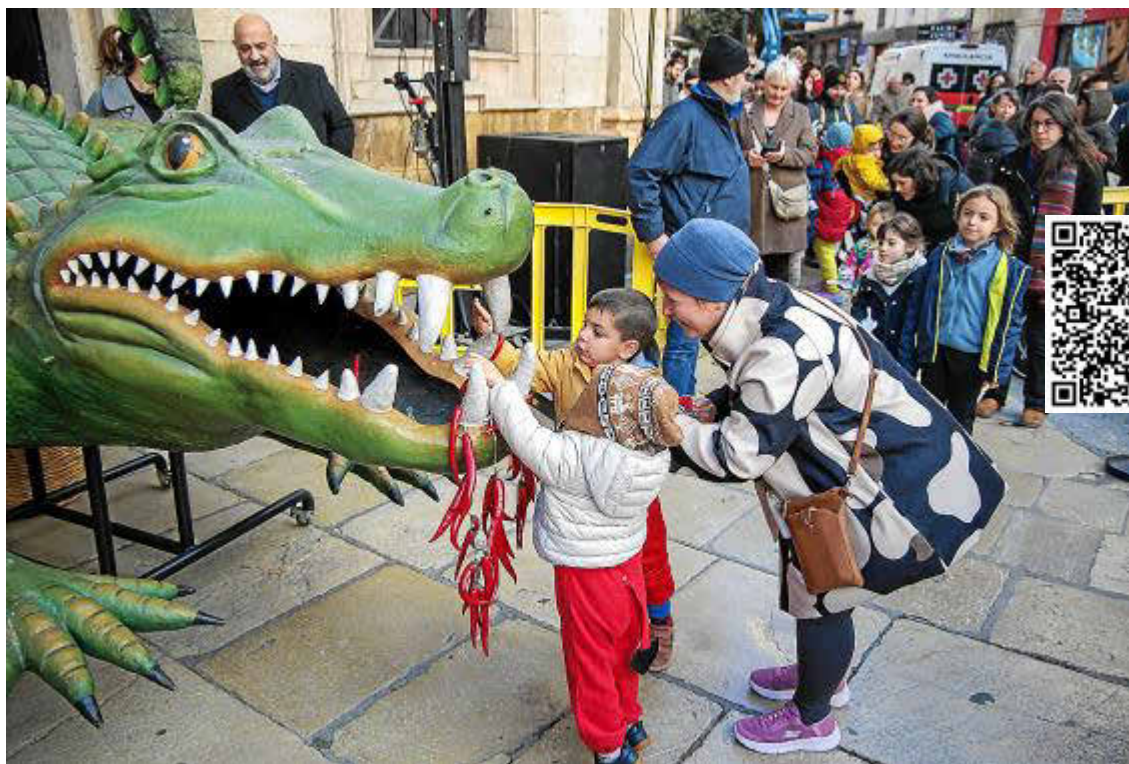
El Drac de na Coca será el protagonista de varios cuenta cuentos el 21 de enero.