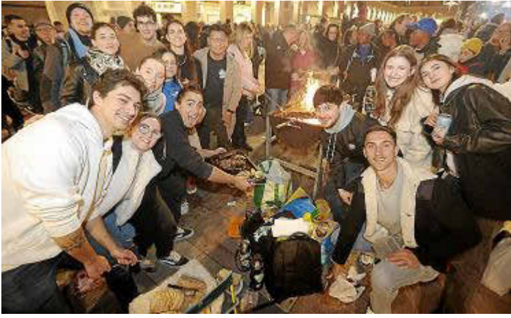
Una vez más, regresa el ambiente festivo y los encuentros sociales alrededor de las torradoras que se habilitan para las fiestas.

Llega Sant Sebastià con un modelo festivo apoyado en los barrios, la participación y la identidad colectiva y sin renunciar a la esencia popular de la fiesta