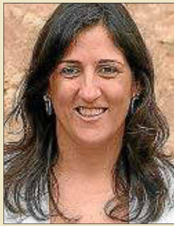
Francisca Porquer, alcaldesa de Campos

«Ha sido un año para mejorar lo que ya tenemos y avanzar superando retos importantes y escuchando a la ciudadanía»