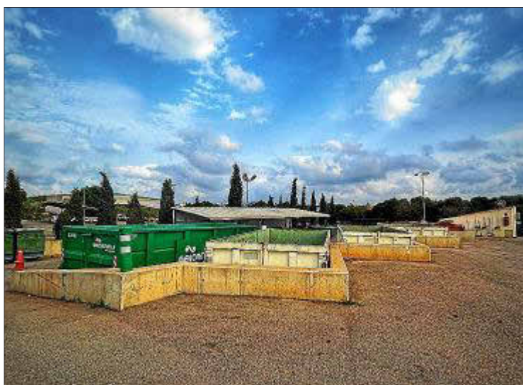
■ Medio ambiente. Se ha mejorado el servicio en algunos puntos verdes.

El turismo ha centrado buena parte de la atención de los responsables municipales, especialmente en aquellos municipios donde esta industria tiene un