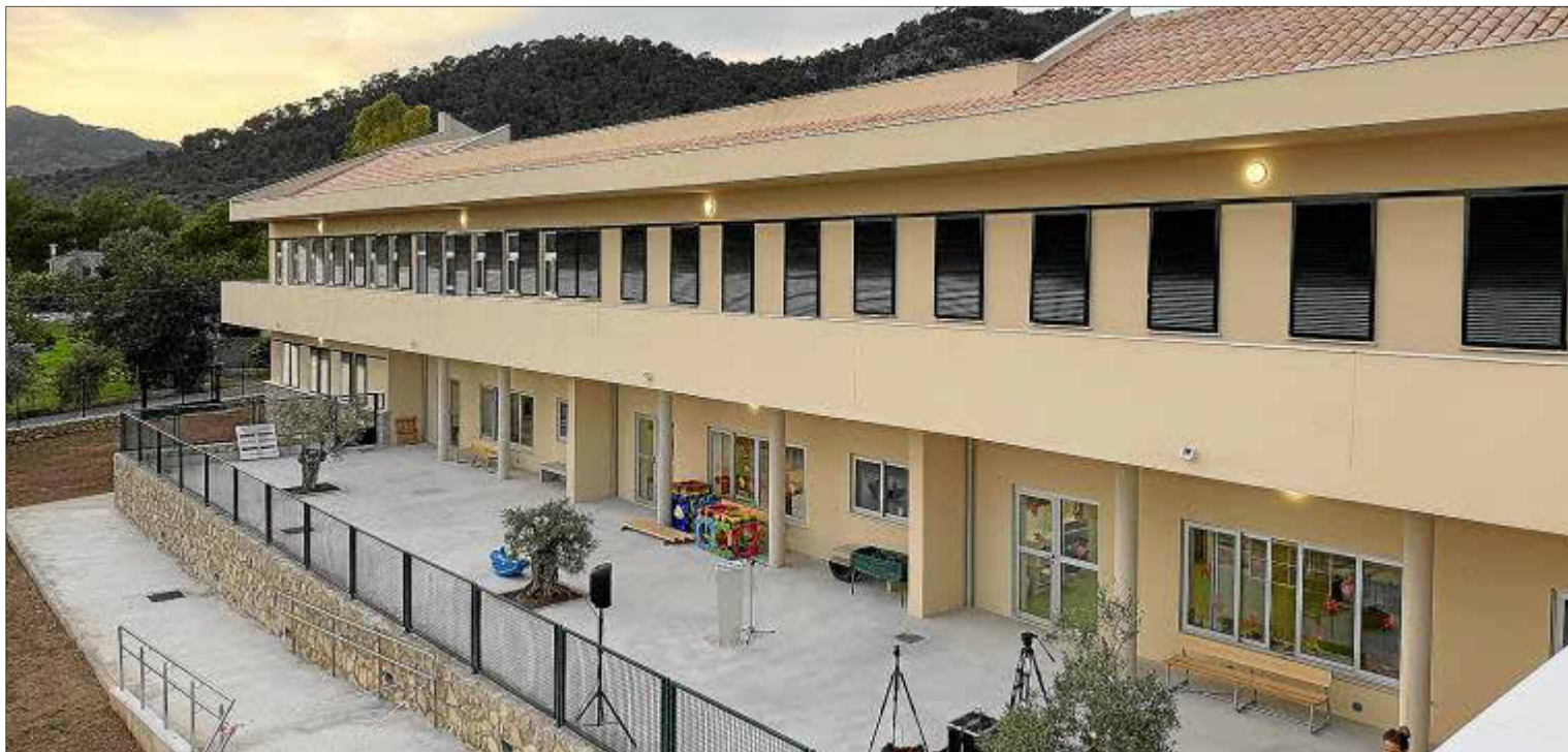
■ Escuela. Caimari, en el municipio de Selva, cuenta con una nueva infraestructura educativa desde que el pasado mes de noviembre se inaugurara el CEIP Ses Deveres.