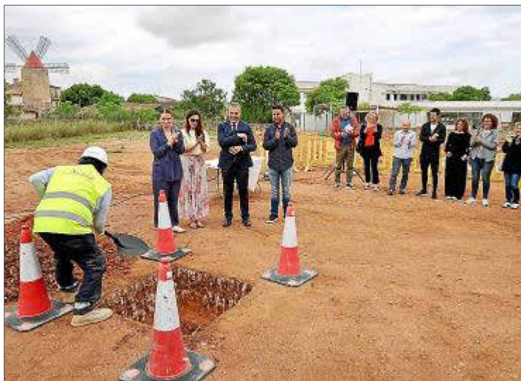
■ Educación. Se han puesto en marcha ampliaciones como la del CEIP de Algaida.

mayor peso. En líneas generales se busca una nueva definición del sector, adaptándolo a las necesidades de los mercados. La sostenibilidad, la puesta en valor de la cultura y las tradiciones, la oferta de nuevos atractivos o la mejora de las infraestructuras que acogen a los visitantes ha sido clave en este asunto.