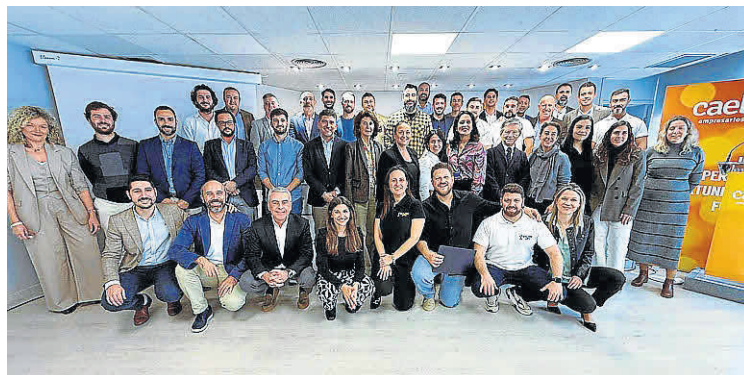
Participantes del XX Programa Avanzado de Dirección General.

acerca formación de alto nivel, con la colaboración de escuelas de negocios de referencia, universidades y consultorías especializadas,