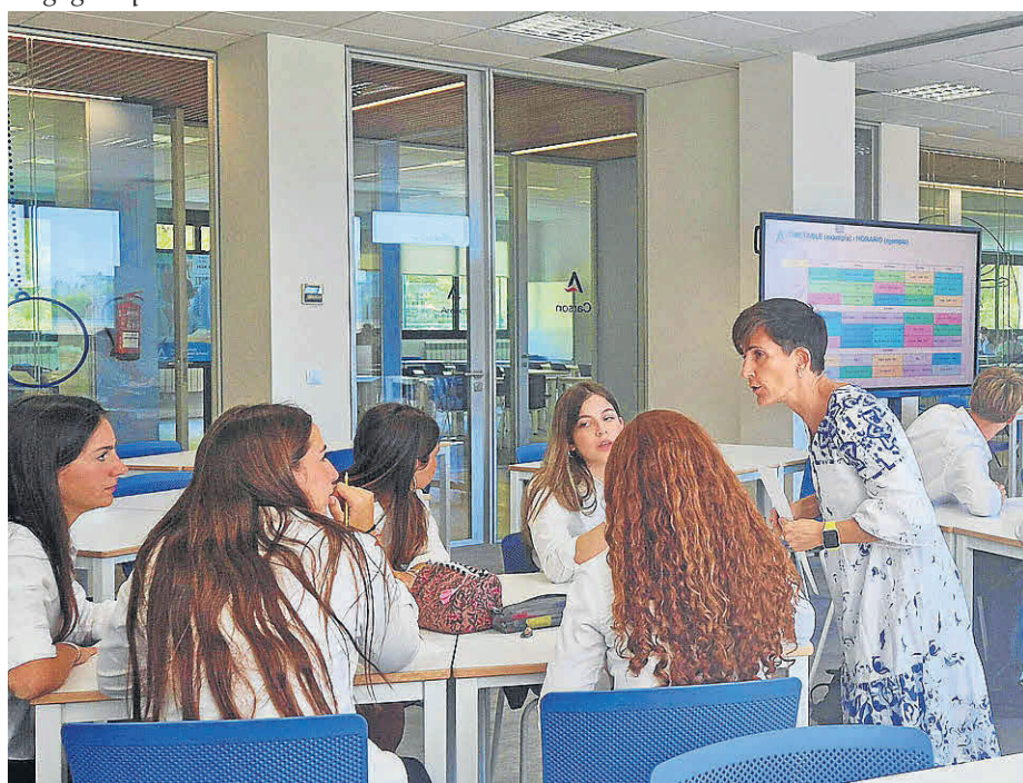
El Agora Talent Hub es el salto desde un modelo centrado en la transmisión de información a un modelo centrado en la construcción activa del conocimiento.