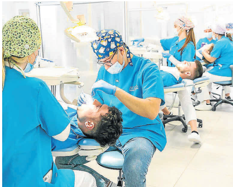
ADEMA ofrece cinco grados universitarios oficiales: Odontología, Bellas Artes (en castellano e inglés) y Nutrición Humana y Dietética.

—Campus Inca: Especializado en Enseñanzas Artísticas Superiores y Diseño. Acoge el nuevo Grado en Diseño con especialidades como Moda, Interiores, Gráfico o Producto, así como másteres en Diseño de Interiores, Diseño de