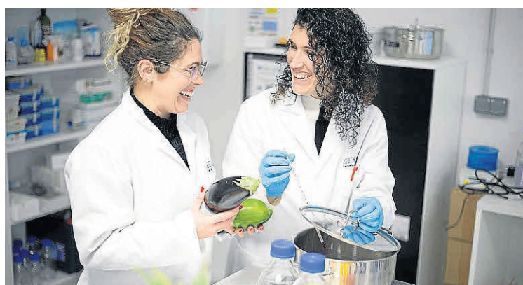
La empleabilidad es una constante en estas titulaciones.

Contará con dos centros de investigación en Ciencias Médicas y en Bellas Artes y Diseño