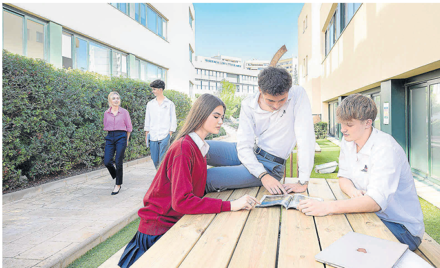
Los alumnos de Bachillerato de Agora Portals podrán desplegar todo su potencial en un entorno muy similar al universitario y laboral.

La apertura del Agora Talent Hub no se entiende sin la conexión con el Bachillerato Internacional (IB Diploma Programme – DP), uno de los programas más prestigiosos del mundo.