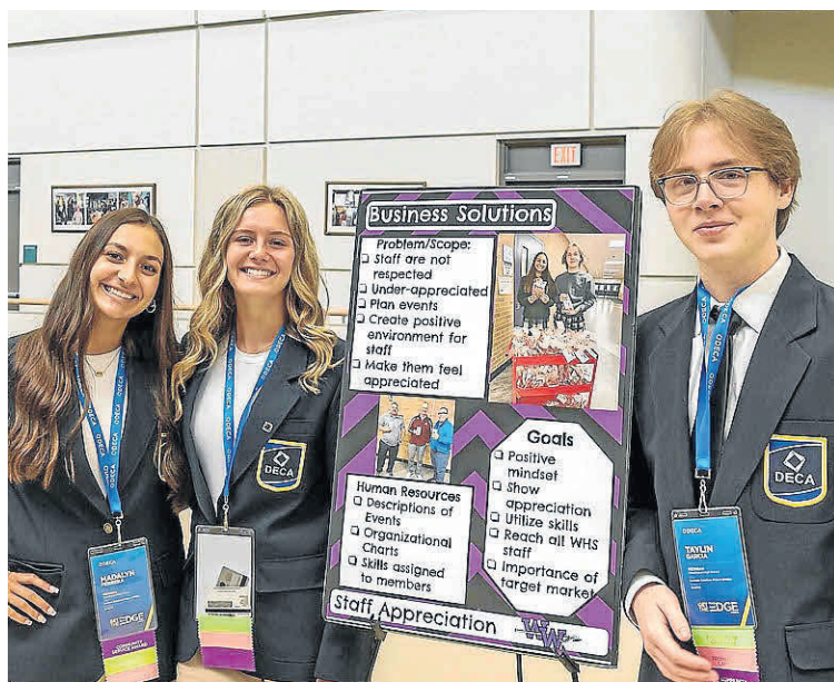
La vida académica internacional incluye mucho más que clases: en Fábrica de Valientes apuestan por clubs como DECA, donde los estudiantes entrenan emprendimiento, creatividad y liderazgo.