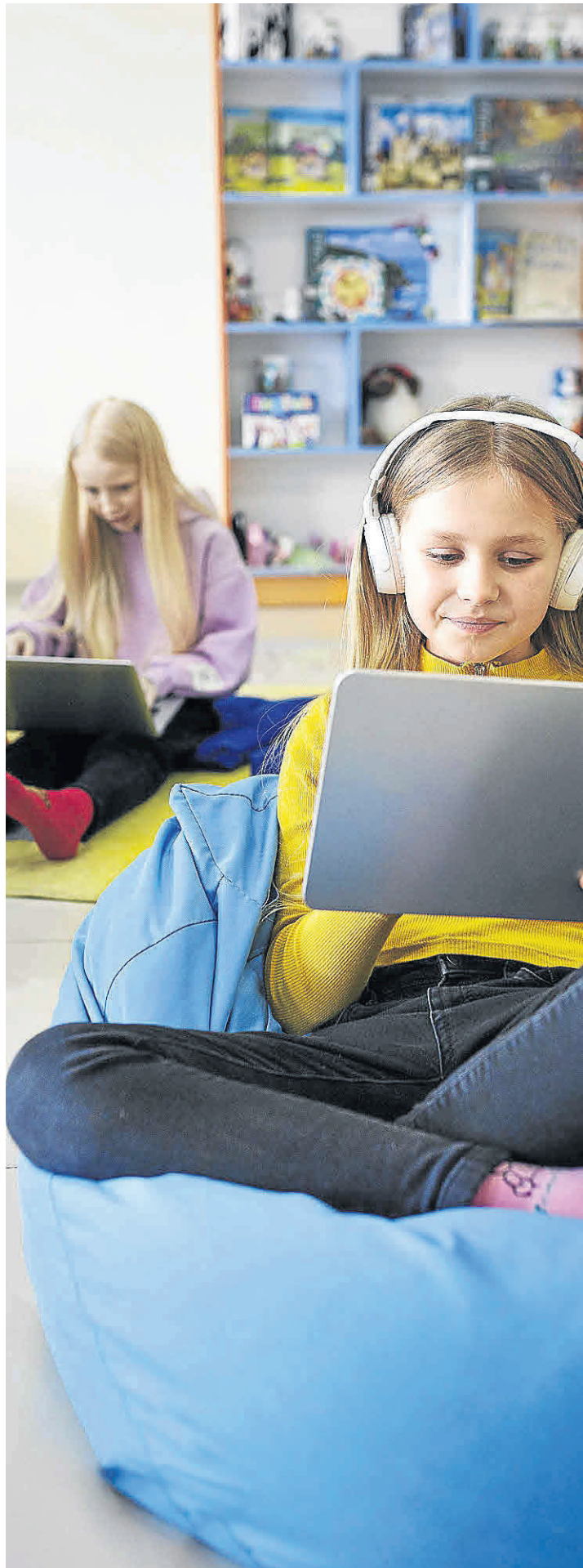
Un uso indebido de las pantallas puede provocar, entre otros, un bajo rendimiento académico.

La capacidad de atención de los niños es cada vez más limitada por el uso de las tecnologías, según el Consejo General de la Psicología de España